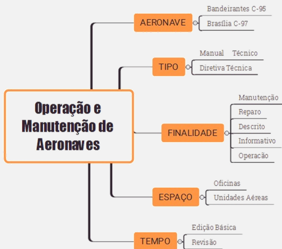
Figura 2: Categorias e facetas do sistema classificatório

A categoria Tempo refere-se a períodos. Nesse trabalho, tempo diz respeito à versão dos documentos e seu status de atualização, característica essa intrínseca das publicações técnicas. As facetas são: Edição Básica e Revisão .