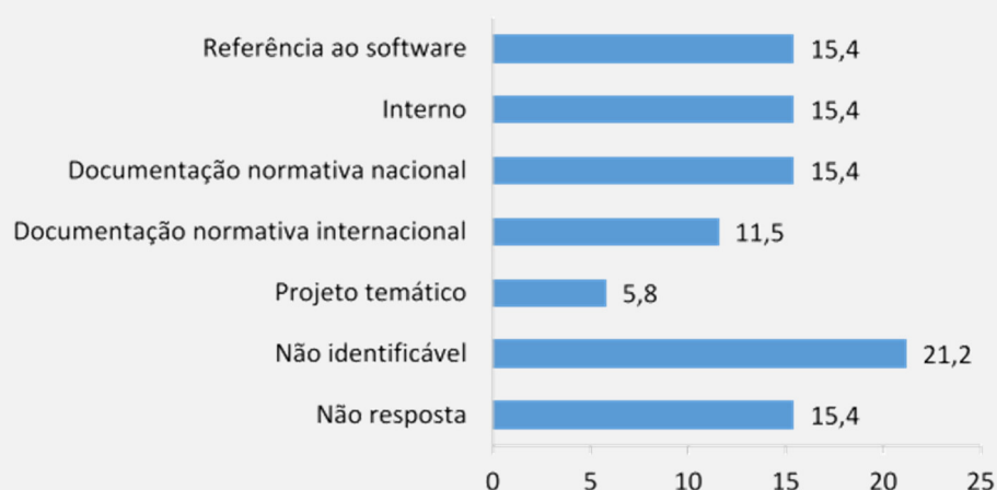
Figura 4 Vocabulário controlado utilizado (Santos, Serôdio, & Ferreira, 2017, p. 58)

O panorama relativo à utilização dos vocabulários controlados traçado com base nas respostas apresentadas no Diagnóstico é indicador da relevância da continuidade do debate e discussão sobre esta temática, não só pelo elevado número de respostas que indica não os utilizar, mas também pela aparente confusão concetual entre ferramentas terminológicas e sistemas de informação. Do mesmo se conclui que há necessidade de continuar a produzir documentação de apoio.